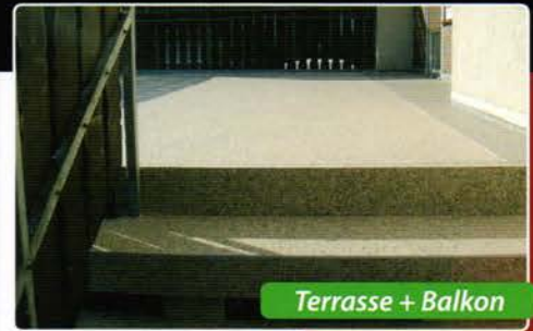
Terrasse + Balkon