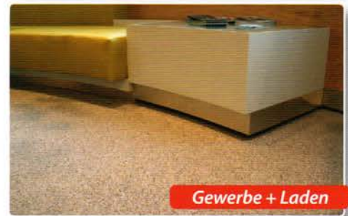
Gewerbe + Laden