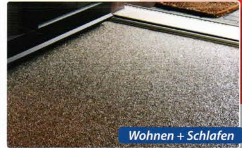
Wohnen + Schlafen